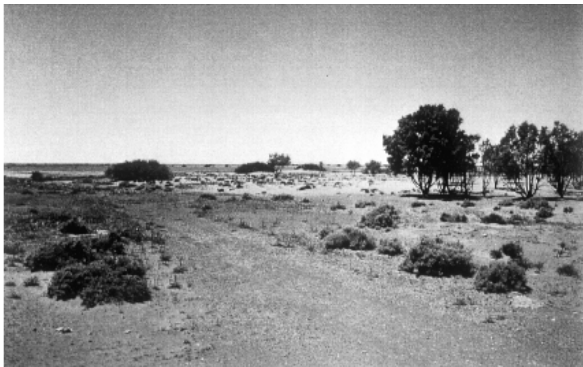
Fig.3 - Station 13 : végétation pré-désertique en bordure d'oued.