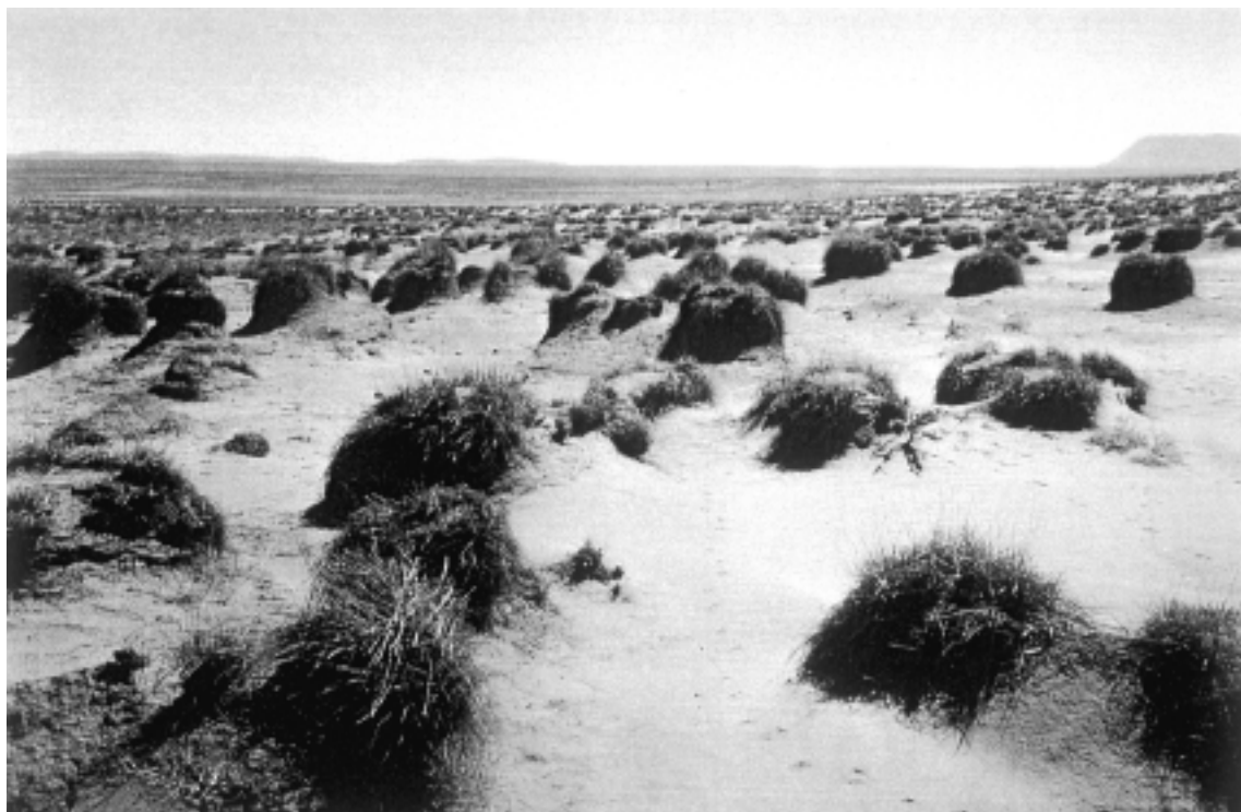
Fig.2 - Station 10 : steppe à alfa.